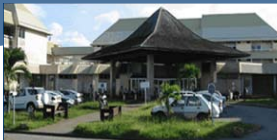
Centre Hospitalier de Cayenne